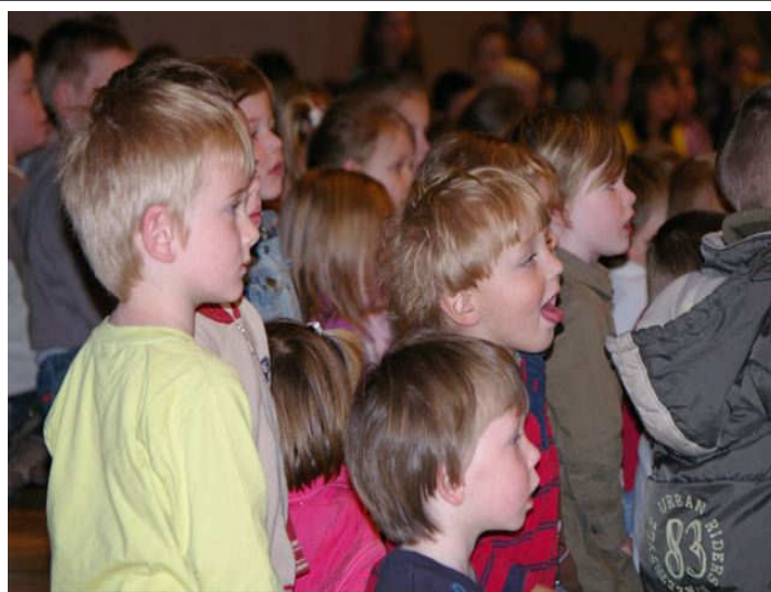
En de kleuters... zij hebben genoten en dit is toch het belangrijkste...

Je krijgt een lidkaart toegestuurd. Je kan lid worden door te storten op ons nummer: 290-0253300-54 met vermelding: gewoon lid: €15 / steunend lid: €25 / erelid: vanaf €4