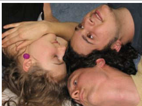
Studenten van de hogeschool Gent Ledeganckstraat