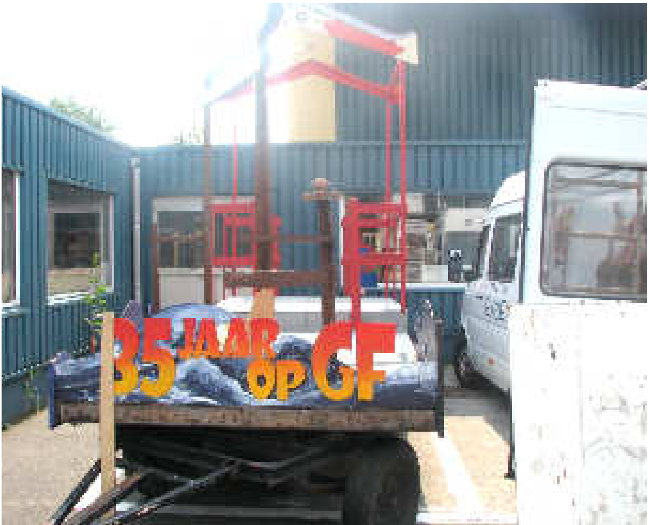
De voorbereidingen voor de Gentse Feesten 2009 zijn gestart - de bouw van de parade praalwagens